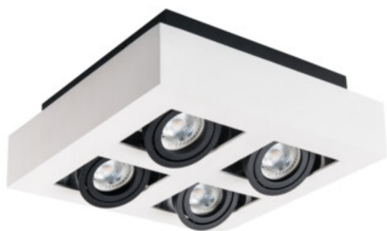
STOBI DLP 450-W